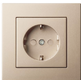
-ramka standard szampański

Przykładowe kompozycje z różnymi ramkami: