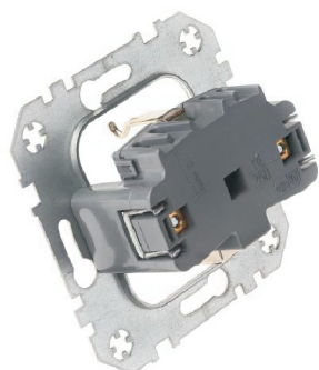
Widok z tyłu gniazda.